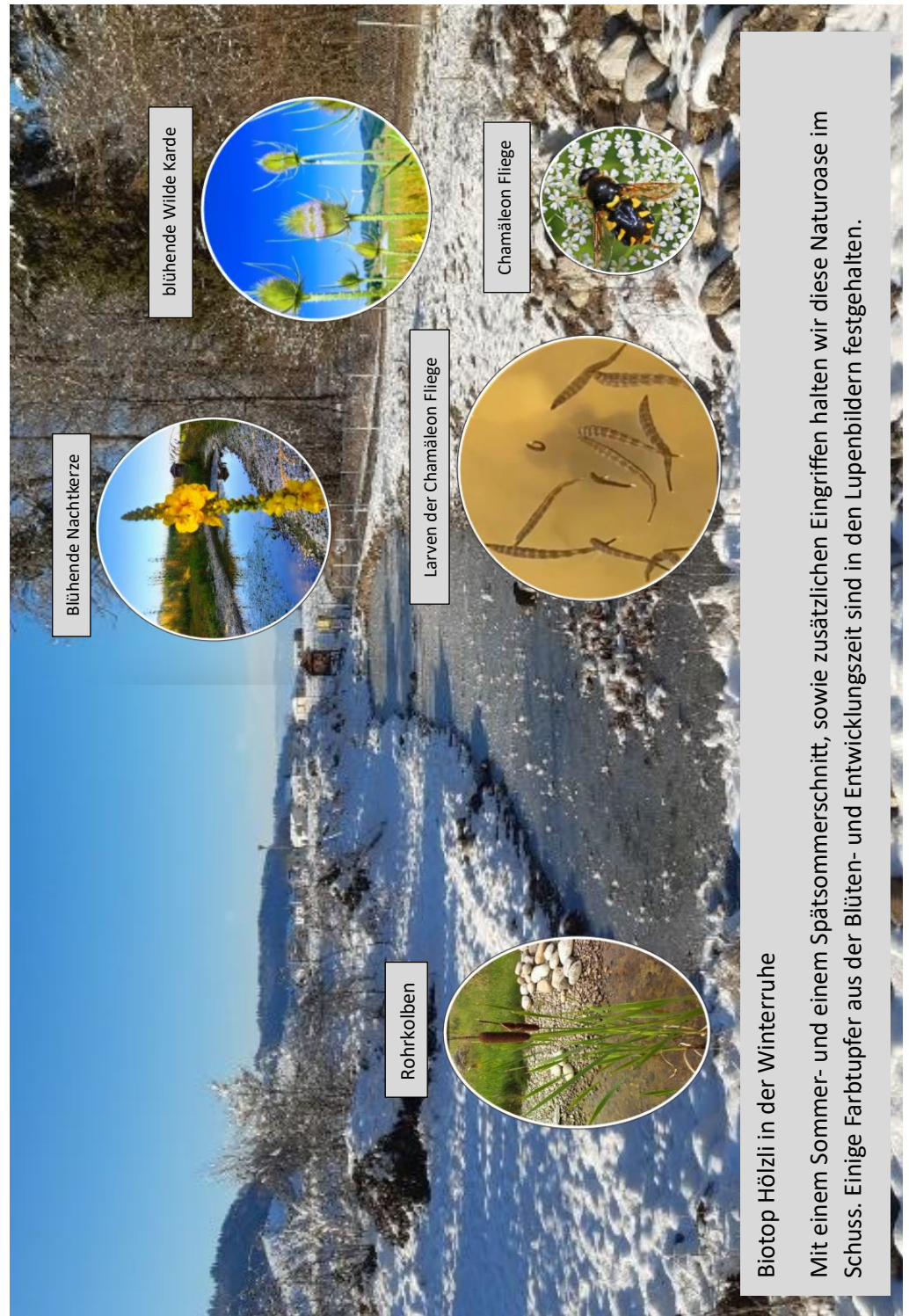
blühende Wilde Karde