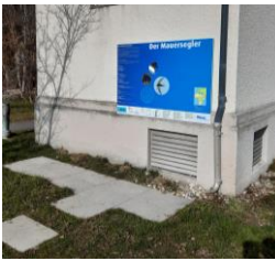
Die neuen Infotafeln sind über Betonplatten leicht zugänglich