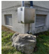
Ein Granitblock schützt das technische Herzstück vor einer Kollision mit dem Rasenmäher.